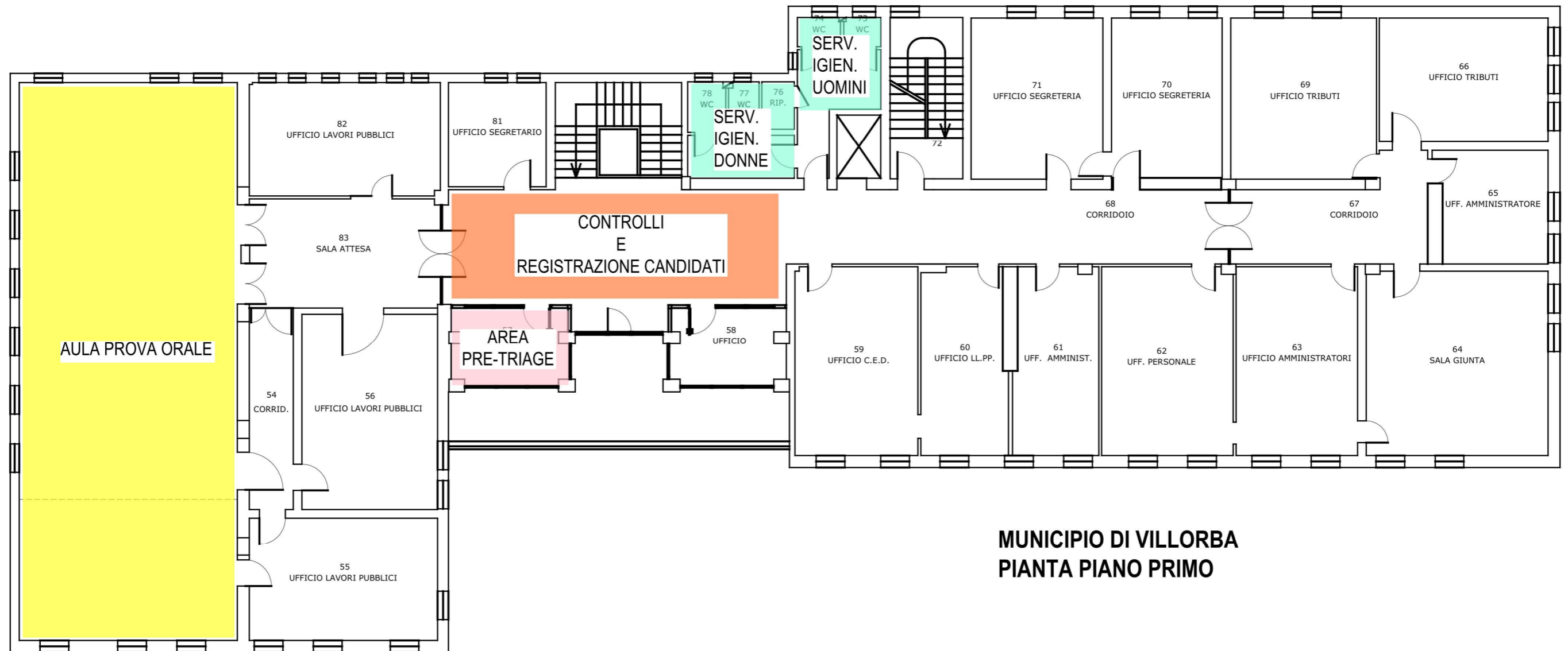
MUNICIPIO DI VILLORBA PIANTA PIANO PRIMO