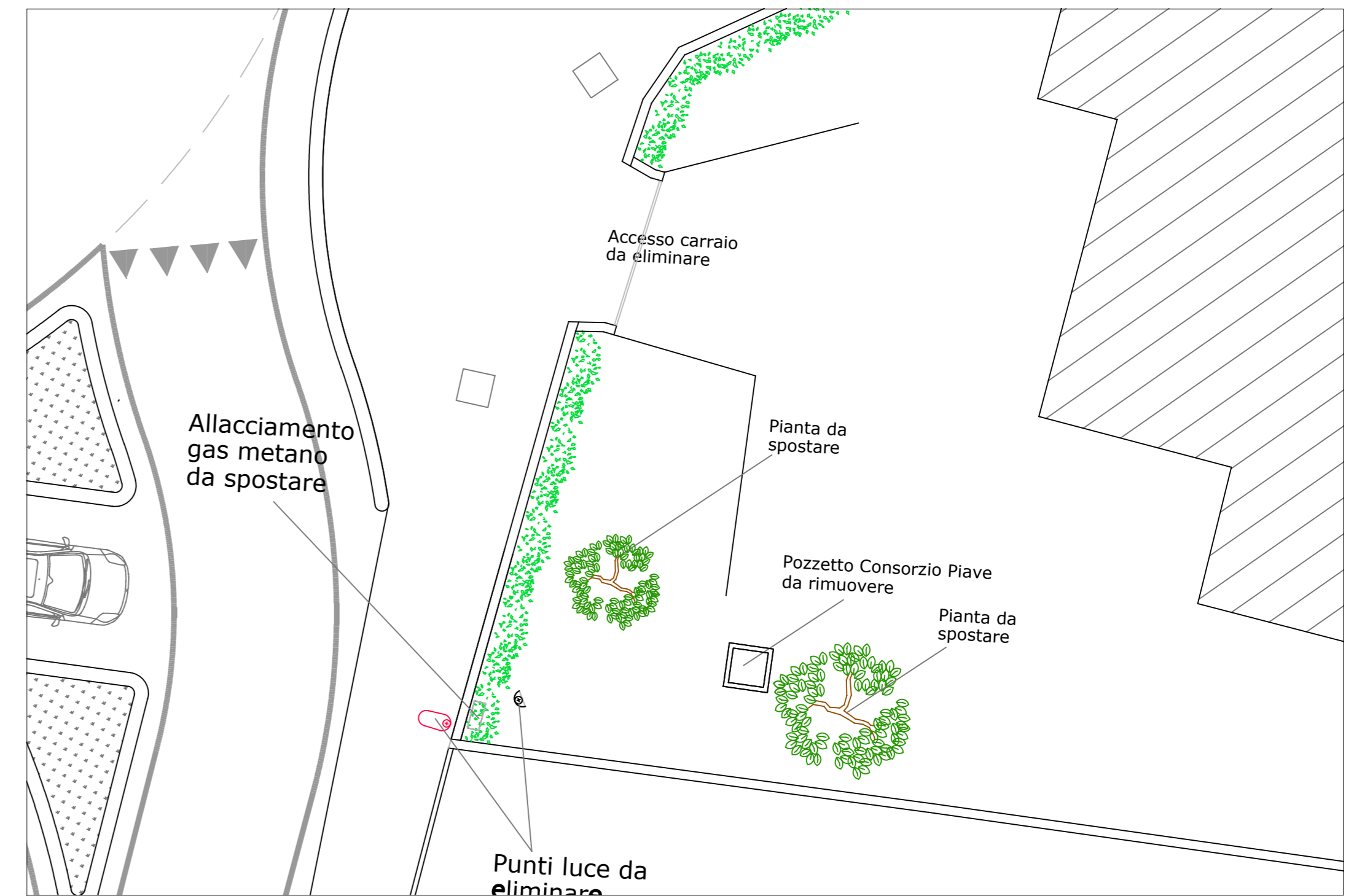
PARTICOLARE SPOSTAMENTO ACCESSO CARRAIO - STATO DI FATTO