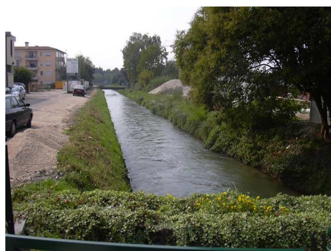
Il canale Pavesella, alimentato con acque del Fiume Piave dalla deviazione di Nevessa