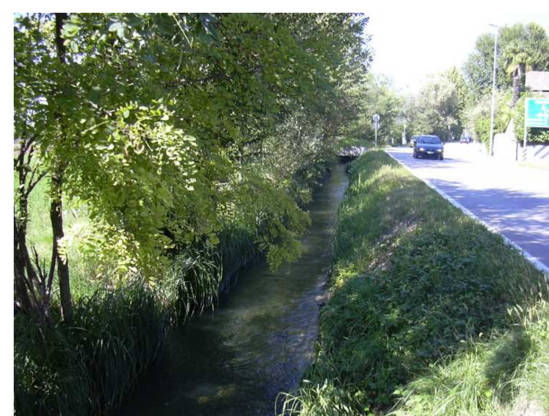
Il canale ergivo di Fontane, alimentato dal Fiume Piave