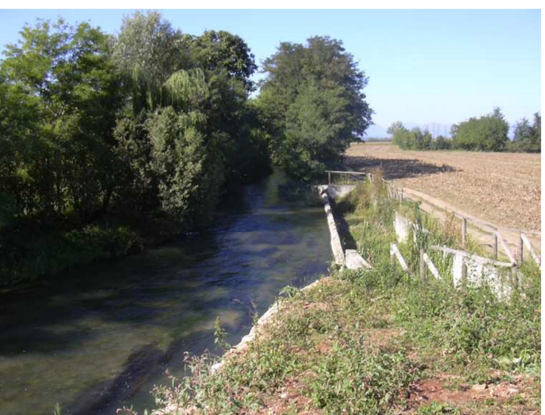
Il torrente Giverra, alimentato nel tratto iniziale del suo corso da acque di origine carsica affioranti ai piedi del Montello